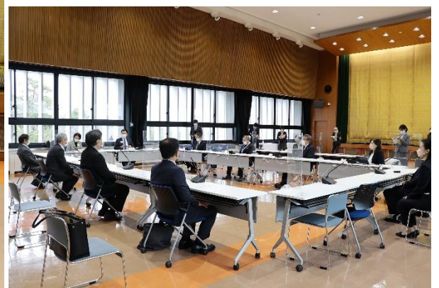
令和5年1月18日（水） 島根県庁舎・講堂