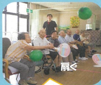
レクの後のお茶は