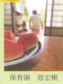
保育園 原宏樹 「平成最後の夏」