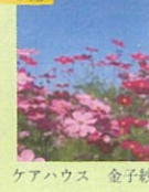
ケアハウス 金子紗絵 「コスモス畑」