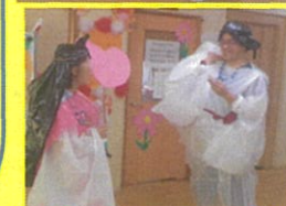
いなほのしろうさぎ