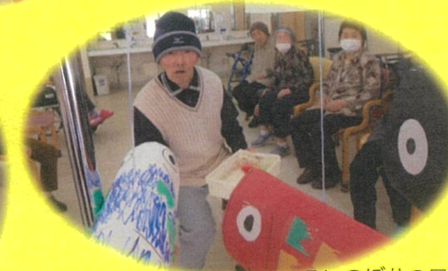
こいのぼりの口へ玉を投げ入れるゲーム?!